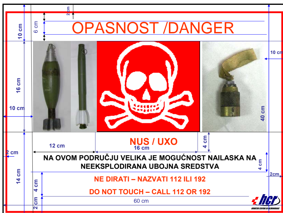
Slika 2 Dimenzije i protezi slova i slika na tabli